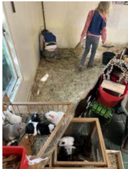
Jeugd vrijwilligers aan het werk — schoonmaken, harken en verzorgen, zowel in de wei als bij de kleine dieren binnen.