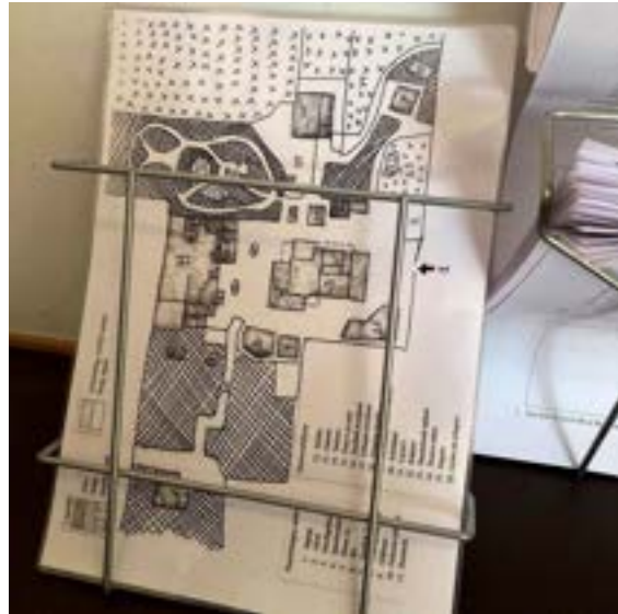
De plattegrond met dierenverblijven en voorzieningen, ontwikkeld voor de speurtochten.