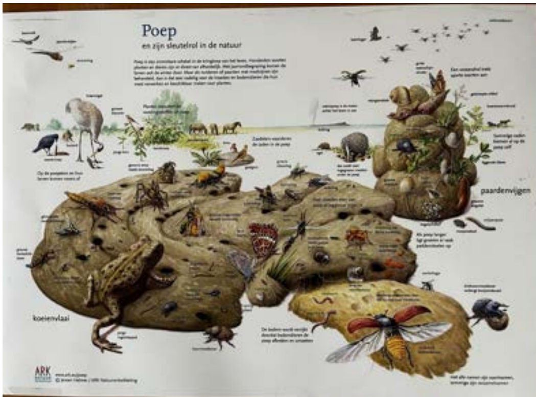
Aan de binnenkant van de kleinere toiletunit hangt deze poster over poep en bodemleven, die ook in andere toiletten van het hoofdgebouw te vinden is — illustratie © Jeroen Helmer / ARK Natuurontwikkeling, ark.eu/poep.