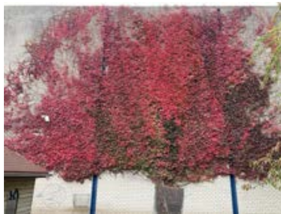
Dezelfde muur, twee herfstweken later — de wilde wingerd boven de schapen- en geitenwei kleurt van groenroze naar vuurrood.