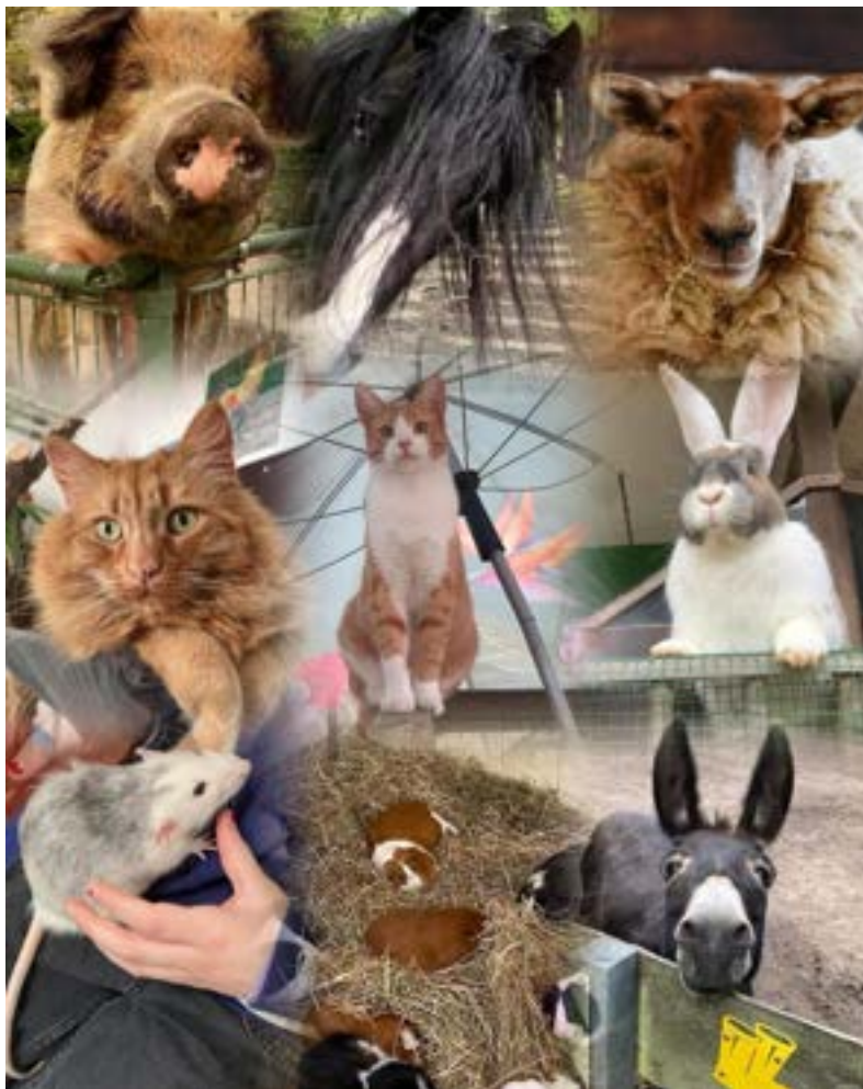
Een greep uit onze dierenfamilie — stuk voor stuk te sponsoren.