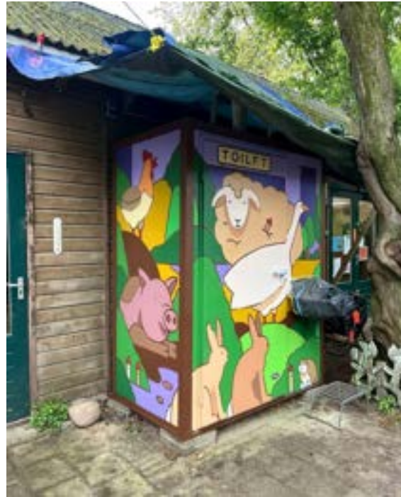
Het resultaat — een vrolijke entree.