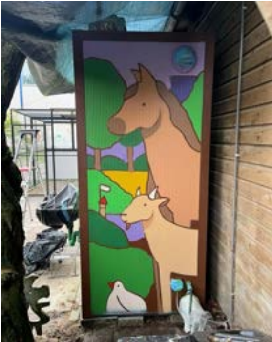
Schilderen — vakwerk in lagen.