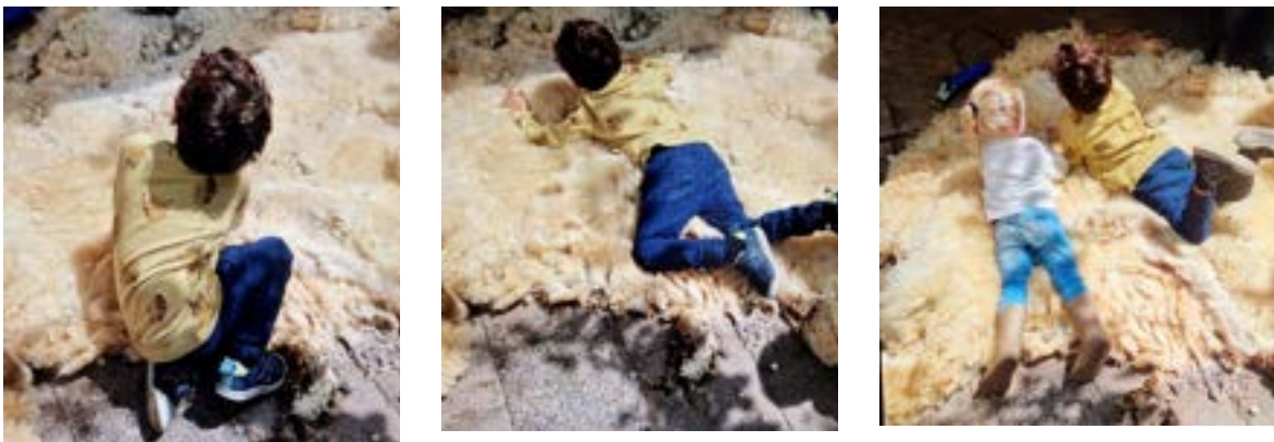
Tijdens het schapenscheerfeest nodigde de scheerster het publiek uit om aan de pas geschorene wol te voelen. Eerst voorzichtig, daarna helemaal languit — de kinderen genoten van de zachte, warme vacht.

Het Schapenscheerfeest is daarmee een mooi voorbeeld van hoe dierenwelzijn, educatie en buurtgevoel op kinderboerderij de Pijp samenkomen: de schapen krijgen de zorg die zij nodig hebben, kinderen leren via direct contact en eigen waarneming over wol, schapen en seizoenen, en de buurt heeft een terugkerend, herkenbaar feestmoment op het erf. In 2025 viel dit feest samen met de vijftiendagste verjaardag van pony Macho, wat het karakter van een gezamenlijk buurtfeest extra onderstreepte.