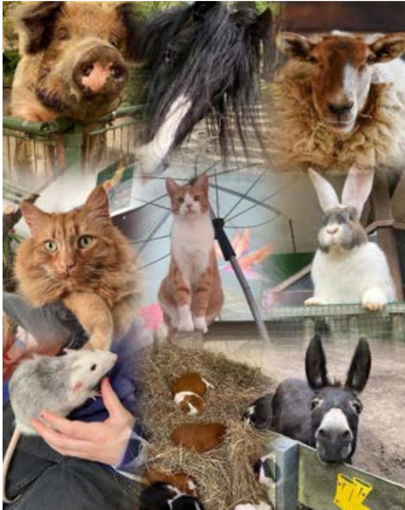
Een greep uit onze dierenfamilie — stuk voor stuk te sponsoren.