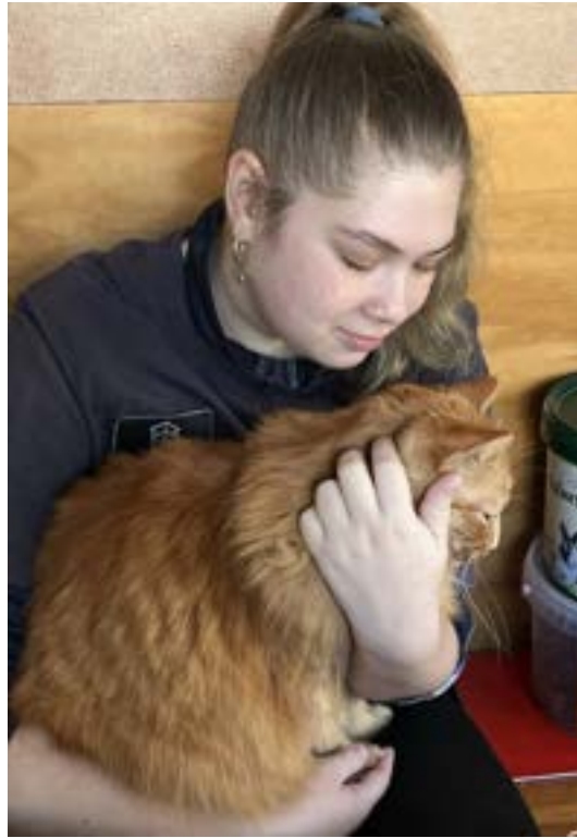
Maren met boerderijkat Loki — een rustig moment binnen.