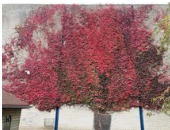
Dezelfde muur, twee herfstweken later — de wilde wingerd boven de schapen- en geitenwei kleurt van groenroze naar vuurrood.