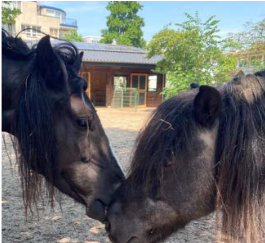
Lola en Macho begroeten elkaar met neus tegen neus — een dagelijks moment van verbondenheid op het erf.

Die korte snuffelmomenten tussen Macho en Lola zijn zo gezien een soort “hoi, alles goed?” tussen pony-vrienden. Het zijn kleine, alledaagse gebaren, maar ze laten mooi zien hoe belangrijk contact, vertrouwen en sociaal gedrag ook bij onze dieren zijn. Het opleidingstraject van Lola, dat in 2025 op de boerderij is gestart en in 2026 na een externe periode van tien weken op opleidingscentrum De Nieuwe Heuvel op de boerderij wordt voortgezet, wordt beschreven in § 8.2; de educatieve inzet van Macho en Lola in het contact met kinderen komt aan bod in § 9.4.