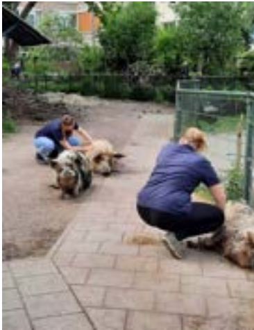
Jodi, Jos en Jaro krijgen alle drie aandacht.

Onze varkens Jodi, Jos en Jaro krijgen dagelijks aandacht van medewerkers en vrijwilligers. Een rondje knuffelen of borstelen hoort er gewoon bij — soms weet je niet wie er meer van geniet, mens of dier.