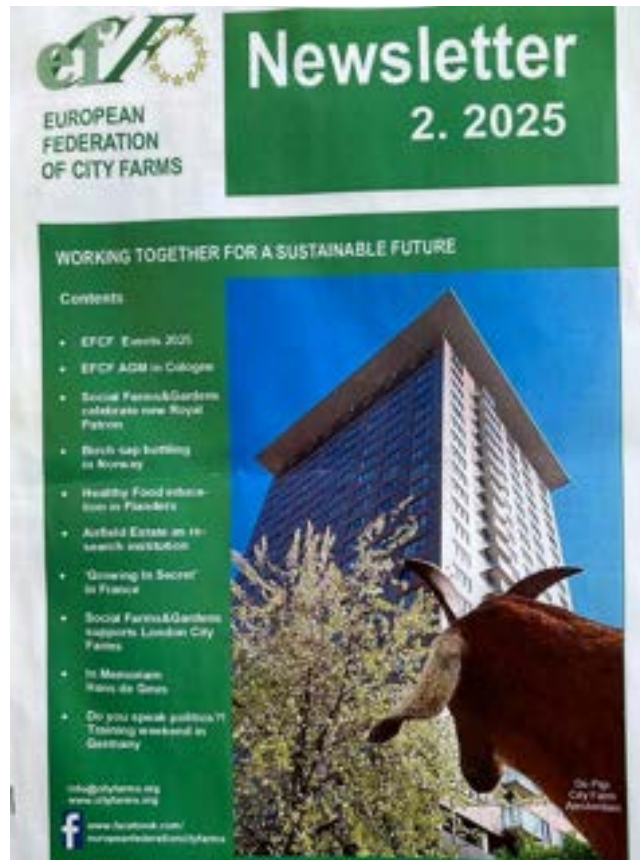
Cover van EFCF Newsletter 2.2025 — Ischa met het Okura op de achtergrond, als sfeerbeeld van een kinderboerderij midden in de grote stad.

Tijdens de conferentie ontstond onder andere contact met een Japanse delegatie, die later in het jaar een dag op de boerderij kwam meedraaien. Ook ontvingen we in juli 2025 een groep oudere tieners van stadsboerderij La Prairie uit het Belgische Moeskroen, voor een EFCF-uitwisselingsproject; de jongeren hielpen mee met de dagelijkse dierverzorging en sliepen één nacht in een ruimte tussen cavia's, vissen, wandelende takken en andere kleine dieren. Deze uitwisselingen laten zien dat kinderboerderij de Pijp niet alleen lokaal, maar ook internationaal wordt gezien als voorbeeld van hoe je educatie, dierenwelzijn en jeugdparticipatie op een kleinschalige, stedelijke kinderboerderij kunt vormgeven.