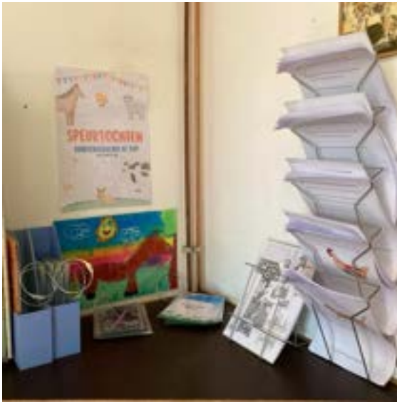
De speurtochten-hoek in de educatieve ruimte — kinderen kiezen hun eigen niveau uit het rek.

Een langlopende stagiaire educatie (eerstejaars pedagogiek) speelde hierbij een grote rol. Zij ontwikkelde de drie speurtochten, werkte de varkensles verder uit met nieuwe opdrachtkaarten en vertaalde de kaartjes van de les “Meneer de Pauw, hoe staan je ogen nou?” naar het Engels, zodat ook internationale ouders en hun kinderen de les beter kunnen volgen. Daarnaast is de algemene lesbrief voor scholen herschreven en beter afgestemd op de leerdoelen van het primair onderwijs, zodat leerkrachten makkelijker zien welke lessen passen bij hun groep en thema.