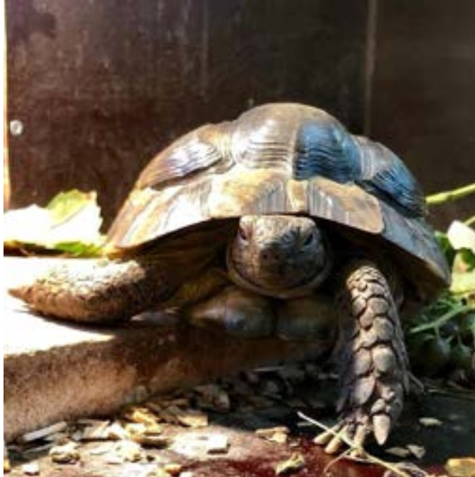
Aurelius in zijn binnenverblijf — portret van onze landschildpad.

Naast de degoes Maren en Zara loopt op kinderboerderij de Pijp nog een ander verhaal dat direct raakt aan wet- en regelgeving en aan ons dierenbeleid: dat van landschildpad Aurelius. Aurelius is inmiddels al meer dan 25 jaar bij ons en stamt nog uit de tijd dat dumpdieren niet altijd door de dierenambulance werden opgehaald. Hij werd destijds, net als zoveel andere ongevraagd achtergelaten dieren bij kinderboerderijen, eenvoudigweg over het hek gezet en bij ons aangetroffen. De boerderij heeft hem toen opgenomen en sindsdien heeft hij een vaste plek gekregen in de educatieve ruimte/schaapskooi.