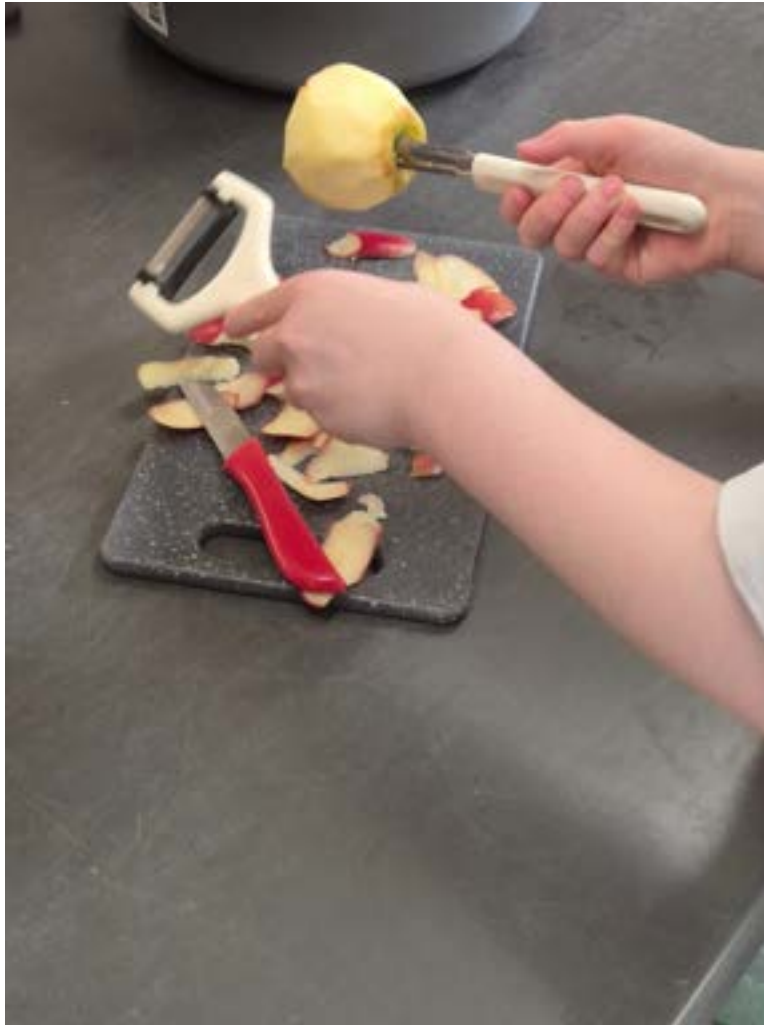
Appels schillen en in stukjes snijden — voor sommige kinderen het lievelingsonderdeel.

De les werkt in een circuit: de hele klas is tegelijkertijd bezig en groepjes wisselen, zodat elk groepje bij elk onderdeel aan de beurt komt. Als alle onderdelen zijn afgewerkt, volgt een pauze. De kinderen eten, spelen buiten en ontdekken de rest van de boerderij; ondertussen wordt de educatieve ruimte omgebouwd voor het volgende deel.