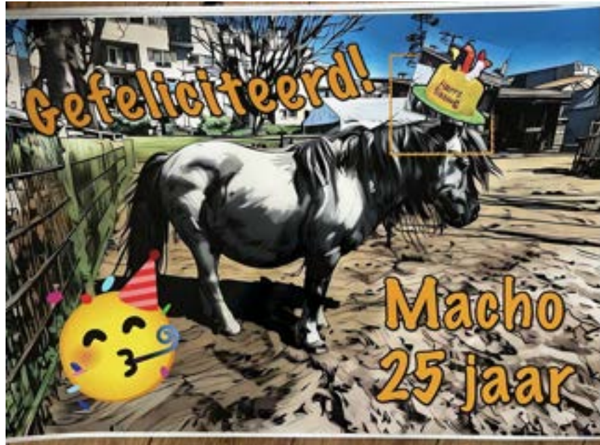
Macho werd in 2025 vijfentwintig jaar — de poster stond op het Schapenscheerfeest tegen het hek van zijn verblijf.