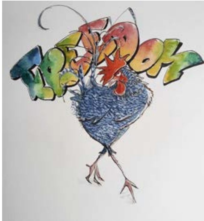
Haan Bor in vrijheid — tekening van Ilja de Jongh. Voor de dagen zonder ophokplicht.

Voor de sabelpootkrielkippen van kinderboerderij de Pijp, die het hele jaar door in het nieuwe kippenhok wonen, wordt deze gedachte nog verder doorgetrokken. Omdat hun bevederde poten minder geschikt zijn voor nat gras en modder, ligt de nadruk bij deze dieren extra op verrijking in het hok: grazzoden of pollen onkruid, stro en hooi om in te woelen, verschillende zitstokken, een kippenschommel, schuilplekjes en een ketting met wisselende stukken groente of fruit waarnaar gezocht en aan gepikt kan worden. Zo kunnen de krielkippetjes ook zonder vaste uitloop naar het erf blijven scharrelen, pikken en ontdekken, en behouden zij hun natuurlijke, levendige gedrag het hele jaar door.