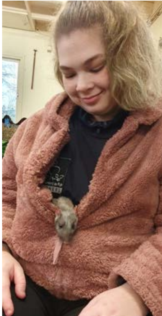
Maren met onze rat Ringo — Ringo is begin 2026 op hoge leeftijd overleden.