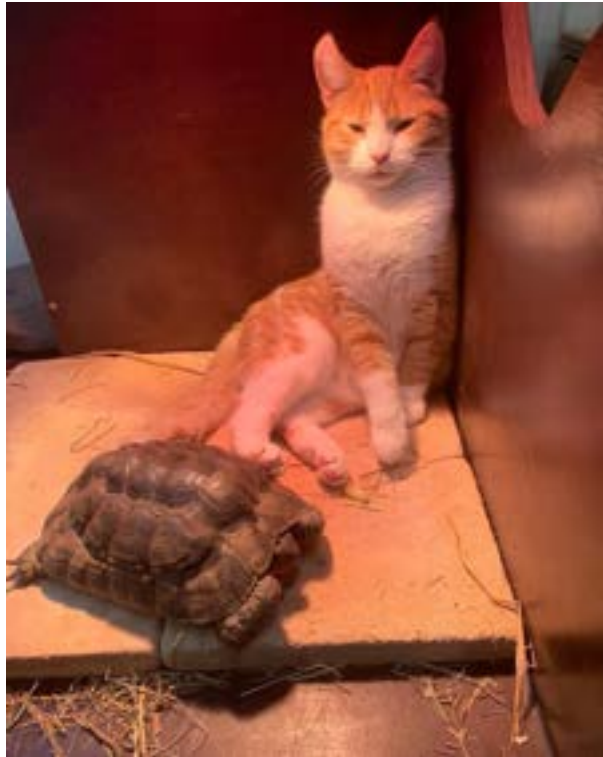
Aurelius en boerderijkat Vondel liggen samen onder de warmtelamp.