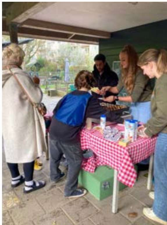
De aftrap van de samenwerking met NL Cares — tijdens de herfstvakantie bakken vrijwilligers samen met buurtbewoners poffertjes onder de overkapping.

In de herfstvakantie van 2025 zijn we een nieuwe samenwerking gestart met NL Cares, een organisatie die vrijwilligers koppelt aan sociale en maatschappelijke initiatieven. De kick-off vond plaats op de boerderij zelf, tijdens een gezellige vakantieactiviteit waarbij samen met kinderen, ouders en vrijwilligers poffertjes werden gebakken. Voor NL Cares-vrijwilligers was het meteen een mooie manier om kennis te maken met kinderboerderij de Pijp, en voor ons een fijne bevestiging dat deze samenwerking past bij wat we willen uitstralen: een laagdrempelige, groene ontmoetingsplek voor de buurt.