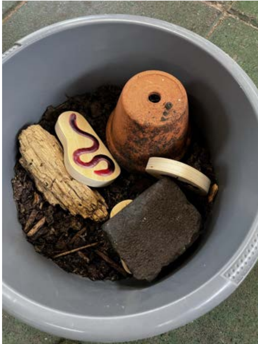
Het lesmateriaal: een ton met aarde, een steen, een stuk hout en een potje, met houten blokjes van een regenworm en andere beestjes om te sorteren.

Daarna komt er een set houten blokjes op tafel: een regenworm, een pissebed, een mier, een spin, een slak en andere beestjes. Naast de blokjes liggen platen met afbeeldingen van plekken in de tuin: onder een steen, in de aarde, op een blad. De kinderen mogen het blokje neerleggen op de plek waar het beestje volgens hen in de tuin woont. Zo praten we samen over waar elk beestje thuishoort, en wat het daar doet.