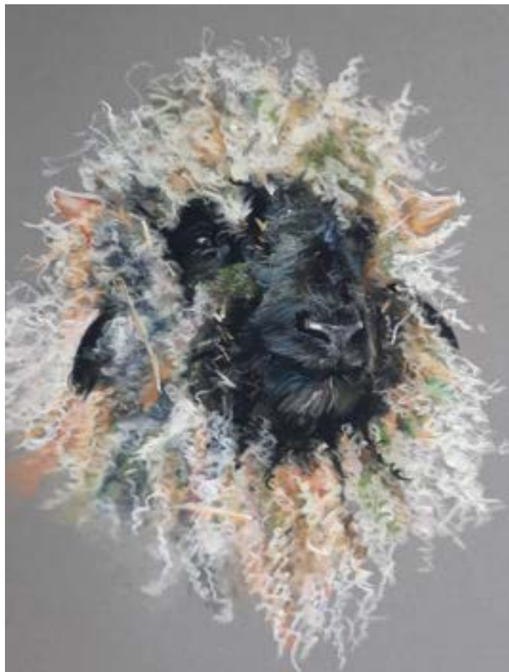
Bolke, onze Wallische Schwarznase — tekening van Ilja de Jongh.

Gedragsverrijking op kinderboerderij de Pijp bestaat niet alleen uit klimmaterialen, afwisseling in voer of speelmogelijkheden, maar ook uit direct, rustig contact met bezoekers. De geiten en schapen op de boerderij zijn stuk voor stuk tam en gewend aan mensen; veel dieren zoeken uit zichzelf toenadering voor een aai, een kriebel of een kort moment van aandacht. Juist deze interactie, mits op hun voorwaarden en met duidelijke afspraken, vormt een waardevolle verrijking van hun dagelijkse leven.