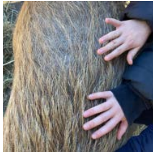
Zon, modder en contact — onze varkens Jodi, Jos en Jaro chillend op de stenen, een portret van Jodi, een modderpoel met de stad op de achtergrond, en het rustige aaien van kinderhanden op een ruige varkensrug.