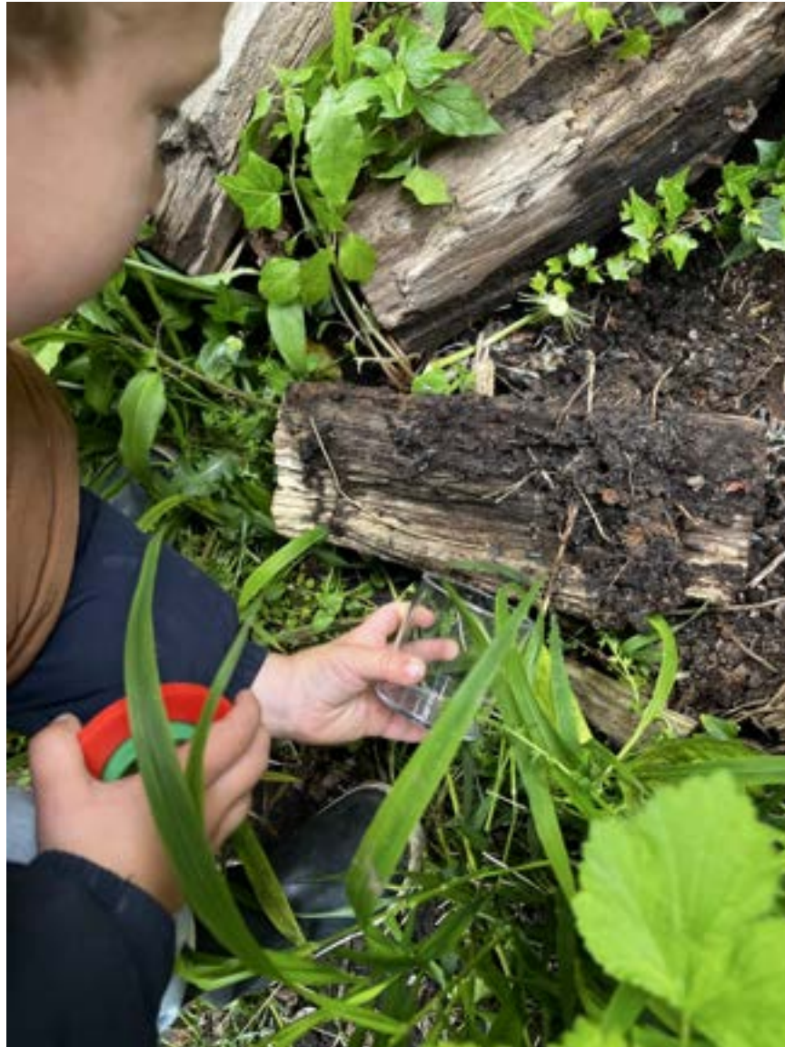
Op zoek met het loepkotje, hurkend bij een stuk hout in de tuin.