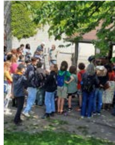
700 bezoekers op het erf.