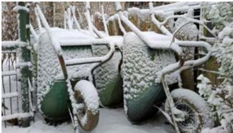
De boerderij in de sneeuw. Kinderkruiwagens om mee te spelen, groene kruiwagens om mee te werken — beide veel gebruikt.