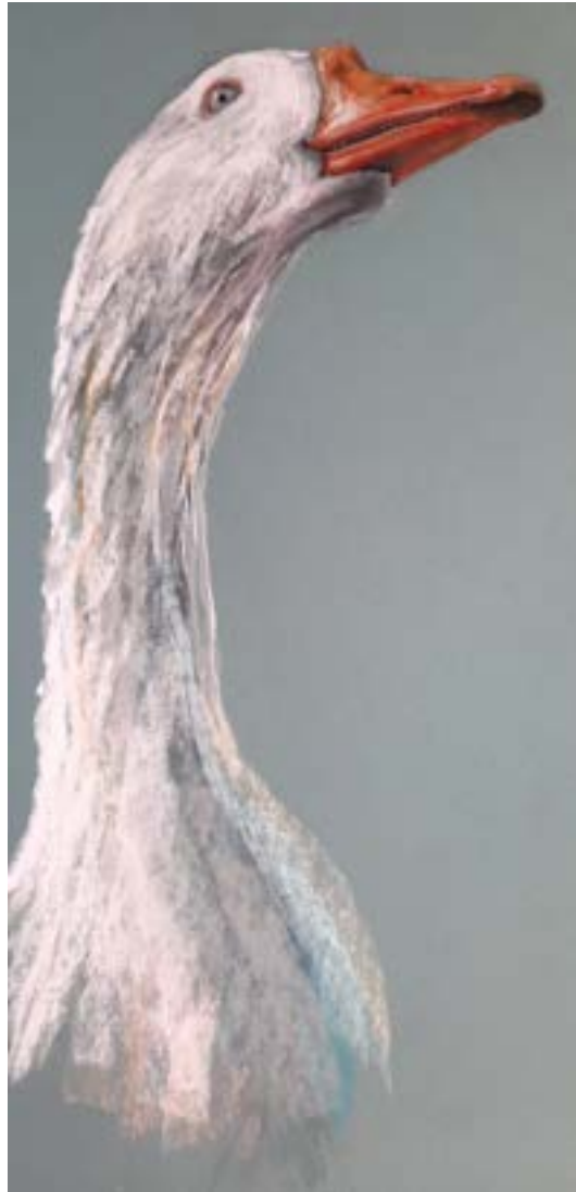
Remi, onze gans (26 jaar) — tekening van IJla de Jongh.