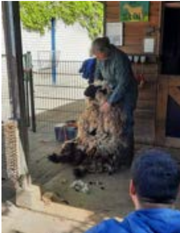
Het scheren — vakwerk in mei.