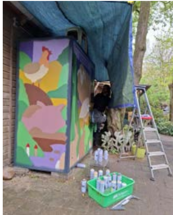
De spuitbussen klaar voor gebruik.