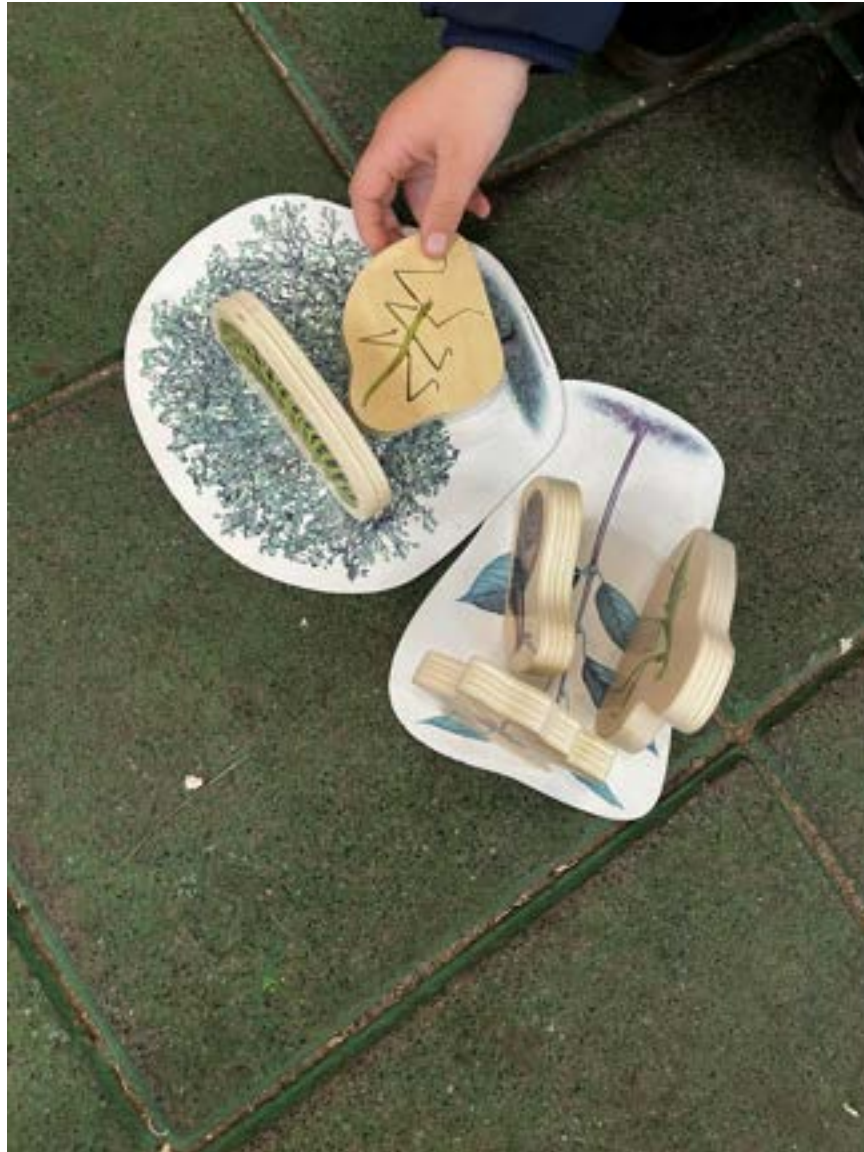
Een kind plaatst een blokje op de plant-plaat — waar denkt het beestje thuishoort?

Vervolgens gaan de kinderen met loeppotje, lepeltje en kwastje de tuin in om echte beestjes te zoeken. Het loeppotje heeft een vergrootglas in het deksel, waardoor je een gevangen beestje van heel dichtbij kunt bekijken zonder het aan te raken. Met het lepeltje en het kwastje kunnen ze voorzichtig een beestje oppakken en in het potje doen. We zoeken samen onder stenen, bij stukken hout en in de aarde — precies op de plekken die we binnen hebben besproken.