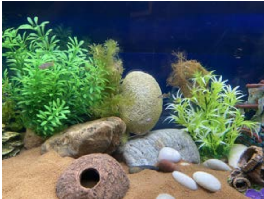
Het nieuwe guppy-aquarium met planten, schuilplekken en stenen — het eerste behaalde doel van een QR-actie op het erf.