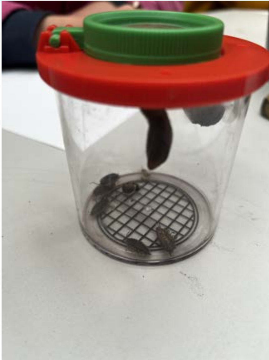
Een geslaagde vangst: pissebedden in het loepotje, klaar om van dichtbij bekeken te worden.

Wanneer ze voldoende beestjes hebben gevonden, gaan de kinderen terug naar de educatieve ruimte. Daar krijgen ze de tijd om een gevonden beestje na te tekenen, met het loepotje ernaast als levend studieobject. Het natekenen helpt om goed te kijken: hoeveel pootjes heeft het, welke kleur, hoe beweegt het. Aan het einde van de les gaan alle beestjes weer terug naar hun eigen plekje in de tuin.