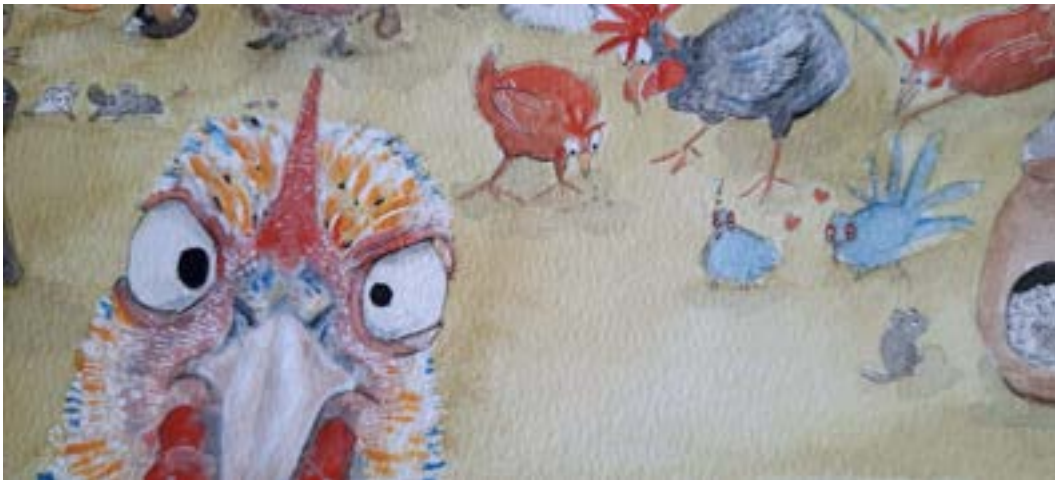
Kippenparade op het erf — aquarel van Ilja de Jongh.

De krielkippetjes worden, zodra maatregelen rondom vogelgriep dat toelaten, actief ingezet in de educatieve lessen rondom de dieren en tijdens de dieren-aai-momenten die de kinderboerderij voor bezoekers organiseert. Kinderen kunnen deze rustige kippen onder begeleiding voeren en zacht aaien, terwijl zij leren hoe je respectvol met pluimvee omgaat en waar een goed kippenhok aan moet voldoen. Daarnaast zijn het prachtige kijkdieren: hun sierlijke bevedering en levendige gedrag maken het vernieuwde kippenhok tot een echte blikvanger op het erf. Vooruitkijkend naar 2026 worden bij dit nieuwe kippenhok ook nog meerdere educatieve borden geplaatst, zodat bezoekers zelfstandig informatie kunnen lezen over het ras, het gedrag en de verzorging van kippen. Op deze manier versterkt het nieuwe kippenhok zowel het dierenwelzijn als de educatieve en maatschappelijke waarde van de kinderboerderij.