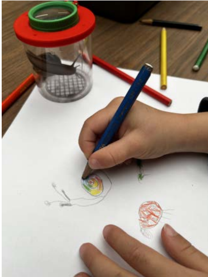
Natekenen van een gevonden slak, met het loeppotje als studieobject ernaast.

Voor oudere groepen wordt dezelfde structuur verdiept met opdrachten rond biotopen, voedselketens en de rol van bodemdieren. Op die manier groeit dezelfde les mee met de leerlingen, en kunnen klassen die de les eerder gedaan hebben er op een ander niveau opnieuw mee aan de slag.