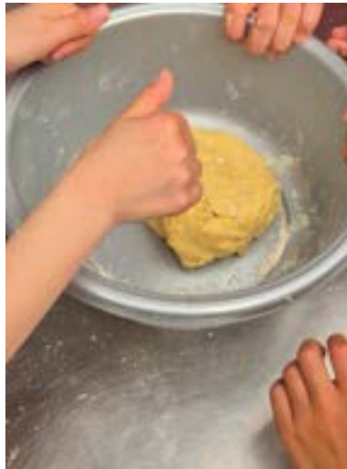
Van losse ingrediënten naar een gladde deegbal.