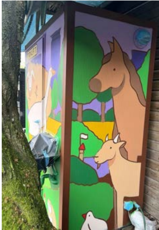
De vernieuwde toiletunit — pony en geit verwelkomen de bezoekers.