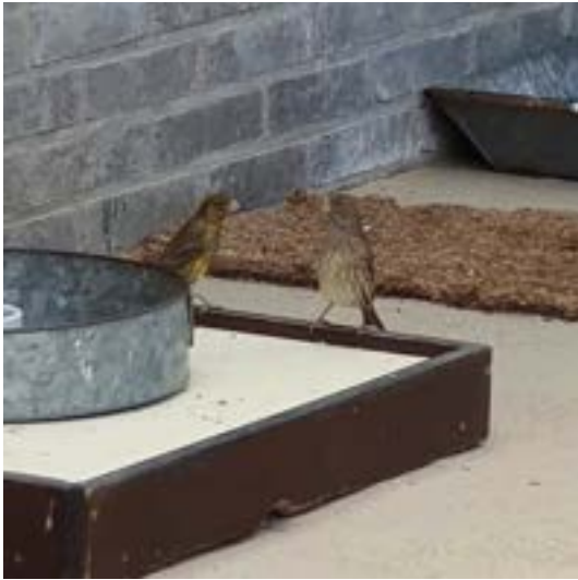
Kanaries op de rand van de voederschaal.