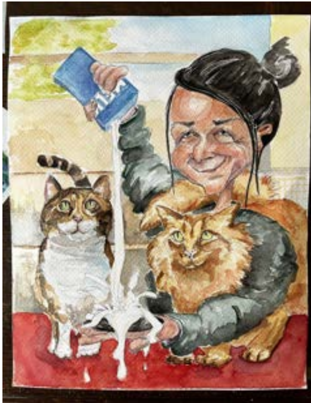
San met boerderijkatten Lieke (lapjes) en Loki (rood) — aquarel van Ilja de Jongh.

In 2025 heb ik opnieuw ervaren hoe bijzonder het is dat kinderboerderij de Pijp midden in de stad een plek is waar kinderen, dieren en buurtgenoten elkaar kunnen ontmoeten. Terwijl de wijk druk en vol blijft, merkte ik elke dag hoe bezoekers hier even kunnen landen: kijken, voelen, ruiken, vragen stellen, gewoon zijn tussen de dieren. Voor veel kinderen is dit een van de weinige plekken waar ze van dichtbij leren wat zorg voor dieren inhoudt en hoe je respectvol omgaat met natuur en met elkaar.