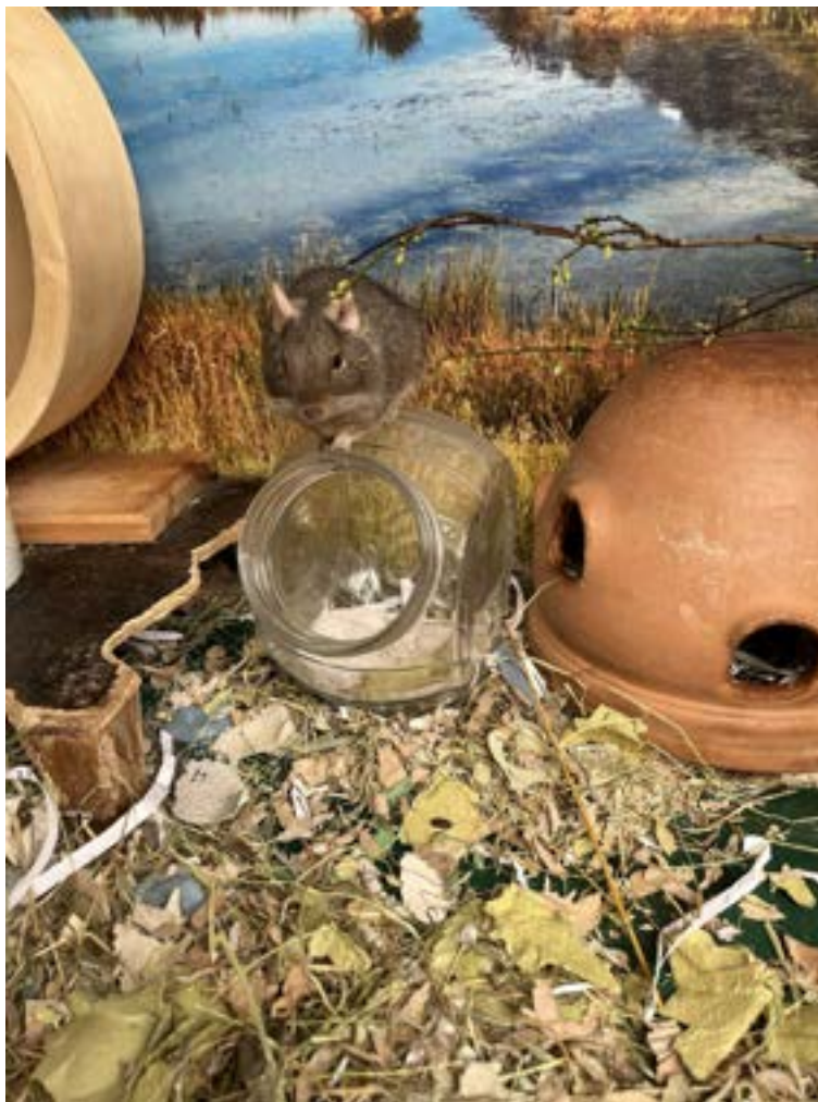
Degoe Maren verkent haar verblijf met verrijkmateriaal: papiersnippers, takken, glazen pot en terracotta-iglo's bieden mogelijkheden om te knagen, klimmen en zich te verstoppen.

Voor Maren en Zara betekent dit dat zij gewoon op de kinderboerderij kunnen blijven wonen, met dagelijkse zorg, aandacht en passende huisvesting, zolang hun welzijn goed geborgd blijft. De controle op naleving van de regels rondom de huis- en hobbydierenlijst ligt bij de Landelijke Inspectiedienst Dierenwelzijn, de politie en de Nederlandse Voedsel- en Warenautoriteit (NVWA). Voor kinderboerderij de Pijp is dit aanleiding om het dierenbeleid steeds scherp te toetsen aan de actuele wetgeving: er worden geen nieuwe dieren opgenomen van soorten die niet (meer) op de lijst staan, en bij iedere soort wordt afgewogen of de boerderij kan bieden wat nodig is op het gebied van ruimte, sociaal contact, voeding en zorg. Tegelijkertijd wordt het verhaal van Maren en Zara actief gebruikt in educatieve activiteiten om bezoekers uit te leggen wat de huis- en hobbydierenlijst is, waarom deze lijst bestaat en waarom het belangrijk is om vóór de aanschaf van een dier goed na te denken over soort, huisvesting, toekomst en wettelijk kader.