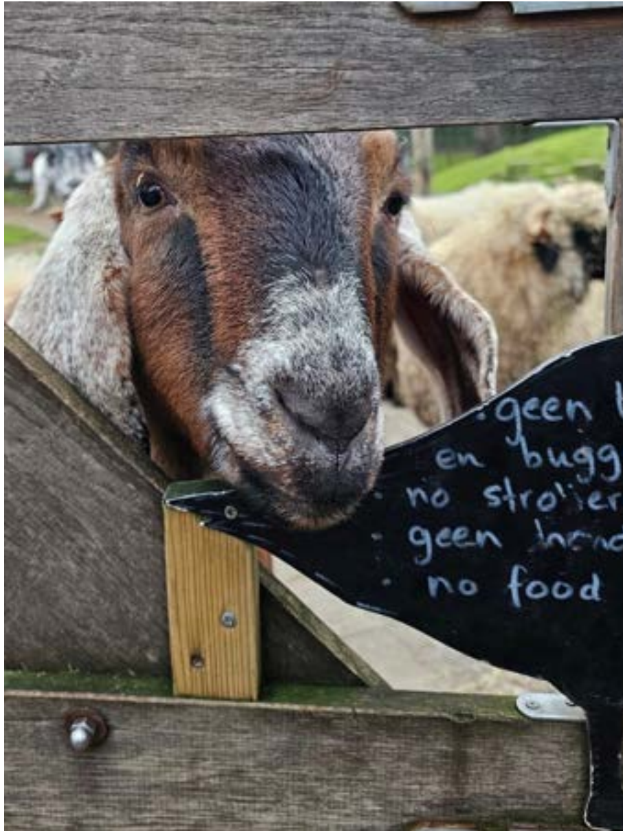
Nubische geit Ischa gluurt door het sluishekje bij de ingang van het geiten- en schapenverblijf. Het regelbordje voor bezoekers ("geen buggy / no strollers / geen hond / no food") komt nét half in beeld — Ischa zelf trekt zich er niets van aan.