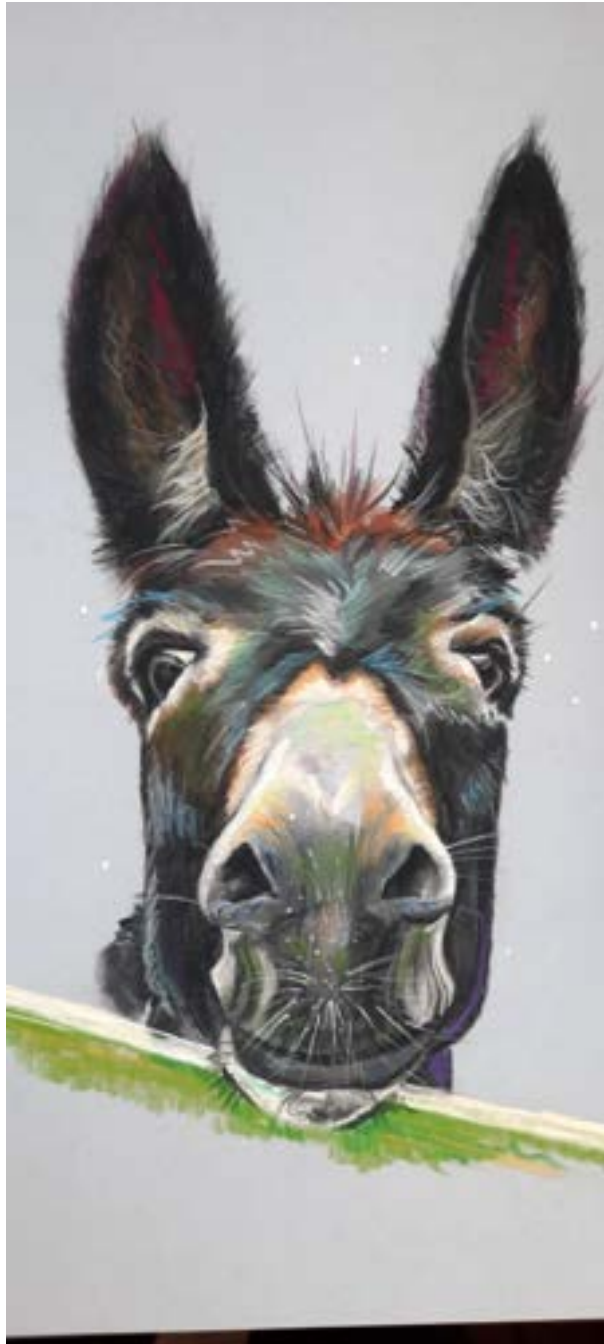
Cato — pastelportret door Ilja de Jongh.