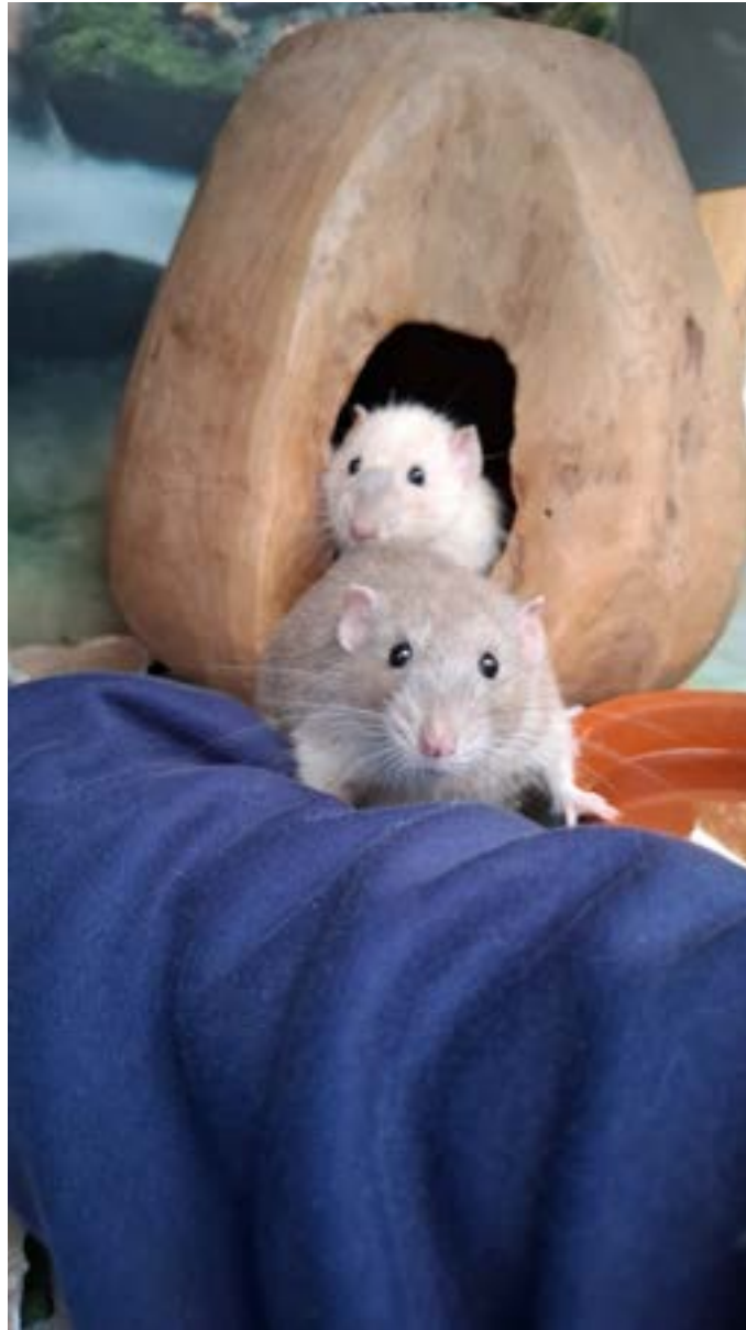
Twee van de nieuwe rattenmannetjes, in 2025 overgenomen van Rattery Het Rattenpaleisje, kijken nieuwsgierig vanuit hun huisje.

Onze twee oudere ratten zijn inmiddels ruim drie jaar oud en om die reden verhuisd naar een kooi die beter past bij hun leeftijd en bewegingsniveau. Omdat ratten echte groepsdieren zijn, is ook voor hun toekomst goed nagedacht over sociaal contact: als één van de twee overlijdt, mag de overgebleven rat terug naar de fokker van de nieuwe groep om daar in een bejaarde mannengroep opgenomen te worden. Dat is een mooie oplossing om te voorkomen dat een sociaal dier alleen achterblijft, en laat zien hoe we samen met gespecialiseerde ratteries zoeken naar de beste opties voor het welzijn van onze dieren.