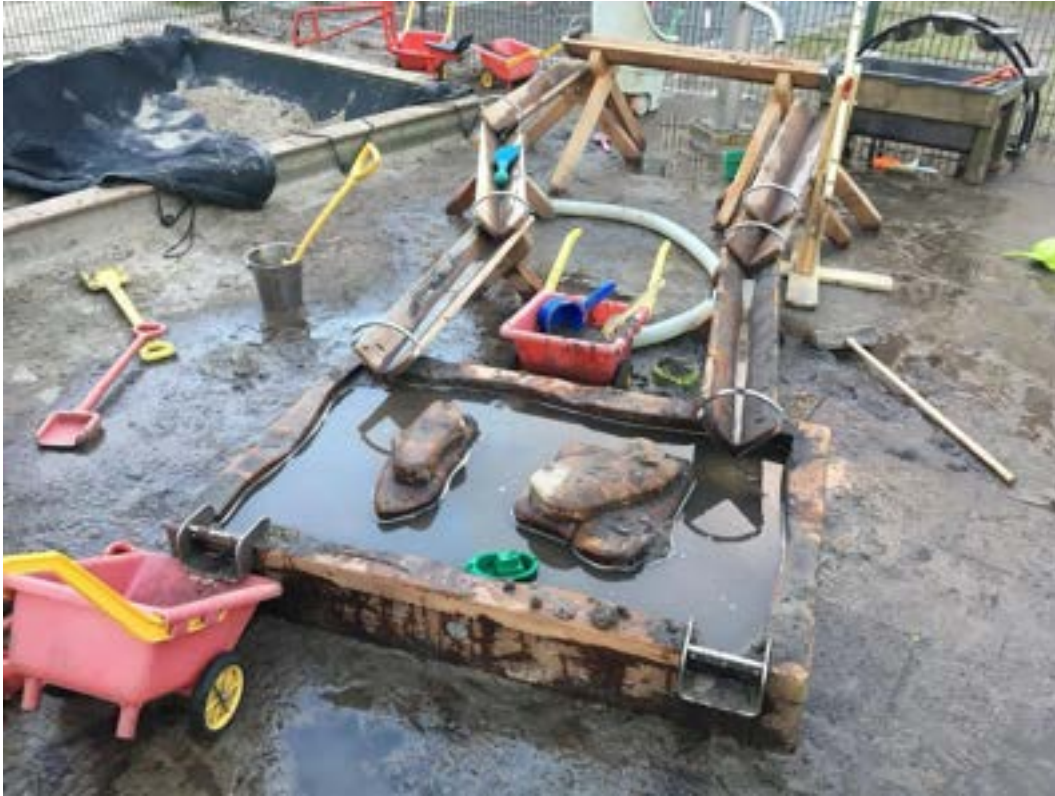
De zand/water/modder-speelplek na sluitingstijd, midden in de winter. Ook met koud weer wordt deze plek volop gebruikt — wat het terrein aan het eind van de dag onmiskenbaar vertelt.

Deze mix van bestuurlijk-financieel nieuws, evenementen, dierverhalen en educatieve content sluit aan bij hoe we ook op het erf werken: warm, persoonlijk en met aandacht voor zowel de dieren als de mensen om hen heen.