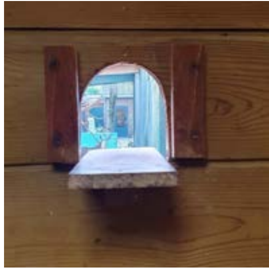
Doorkijk vanuit het binnenverblijf naar het erf.

Een vrijwilliger schreef onderstaande sfeerimpressie, die treffend laat zien hoe een gewone werkdag op de boerderij voelt: