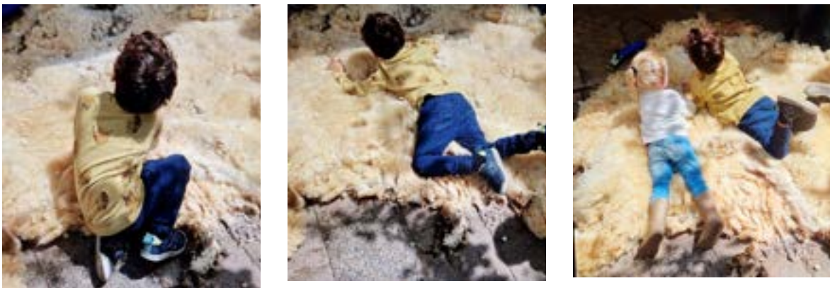
Tijdens het schapenscheerfeest nodigde de scheerster het publiek uit om aan de pas geschorene wol te voelen. Eerst voorzichtig, daarna helemaal languit — de kinderen genoten van de zachte, warme vacht.

Het Schapenscheerfeest is daarmee een mooi voorbeeld van hoe dierenwelzijn, educatie en buurtgevoel op kinderboerderij de Pijp samenkomen: de schapen krijgen de zorg die zij nodig hebben, kinderen leren via direct contact en eigen waarneming over wol, schapen en seizoenen, en de buurt heeft een terugkerend, herkenbaar feestmoment op het erf. In 2025 viel dit feest samen met de vijftiengste verjaardag van pony Macho, wat het karakter van een gezamenlijk buurtfeest extra onderstreepte.