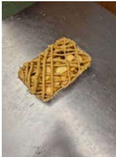
Het deeg uitrollen en de bovenkant naar eigen smaak versieren — geen taart is gelijk.

Waarom deze les werkt. Voedseleducatie staat centraal, maar de kracht van deze les zit in de combinatie van alle aspecten. Kinderen leren veel nieuwe woorden die ze direct koppelen aan echt materiaal en aan een handeling die ze zelf uitvoeren. Voor kinderen die veel weten, is er ruimte om kennis te delen; voor kinderen die juist praktisch zijn ingesteld, zijn de doe-onderdelen vaak het moment waarop zij uitblinken. Voor kinderen die talig zwakker zijn, biedt de koppeling van woord, handeling en zichtbaar voorwerp extra houvast om de stof te onthouden. En aan het einde van dat alles is er natuurlijk het mooiste resultaat: zelf opeten van een appeltaart die je helemaal zelf hebt gemaakt.