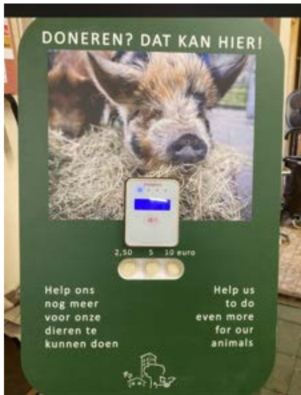
De contactloze doneerpaal bij de boerderij. Bezoekers kunnen met pinpas of telefoon een kleine bijdrage doen — een laagdrempelige, anonieme manier om de dieren te steunen.

Op de boerderij zelf bieden we bezoekers verschillende laagdrempelige en anonieme manieren om een spontane donatie te doen. Naast de vertrouwde contante geefmogelijkheden — het donatiekastje bij de uitgang en de melkbus in het hoofdgebouw — staat er sinds enkele jaren ook een contactloze doneerpaal op het erf. Bezoekers kunnen daar met pinpas of telefoon een kleine bijdrage doen; de donatie komt rechtstreeks ten goede aan de boerderij. Deze paal sluit aan bij de groeiende groep bezoekers die geen contant geld meer bij zich draagt. Samen met de QR-acties die hierboven zijn beschreven, vormen kastje, melkbus en doneerpaal een samenhangend palet van laagdrempelige geefkanalen: iedereen die de boerderij een warm hart toedraagt kan op zijn eigen manier bijdragen — klein of groot, contant of contactloos, en altijd anoniem.