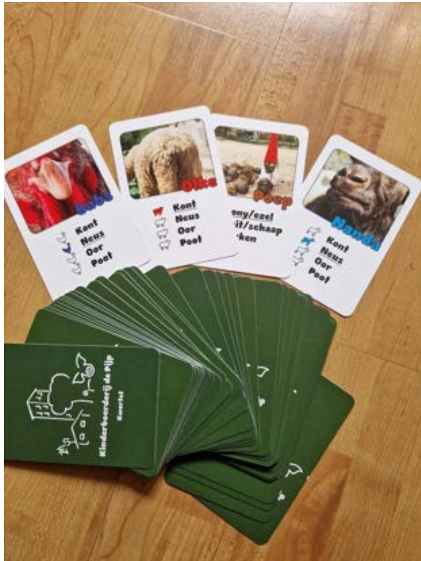
Het kwartetspel met dieren van kinderboerderij de Pijp — oorspronkelijk handgemaakt door twee vrijwilligers, daarna digitaal vormgegeven en professioneel gedrukt.

In 2025 hebben twee van onze vrijwilligers de kinderboerderij verrast met een bijzonder cadeau: een handgemaakt kwartetspel waarin de dieren van kinderboerderij de Pijp de hoofdrol spelen. Zij hebben hier langdurig en in stilte aan gewerkt. Het was een echt liefdewerkstuk, waarin hun creativiteit, kennis van de dieren en betrokkenheid bij de boerderij samenkwamen.