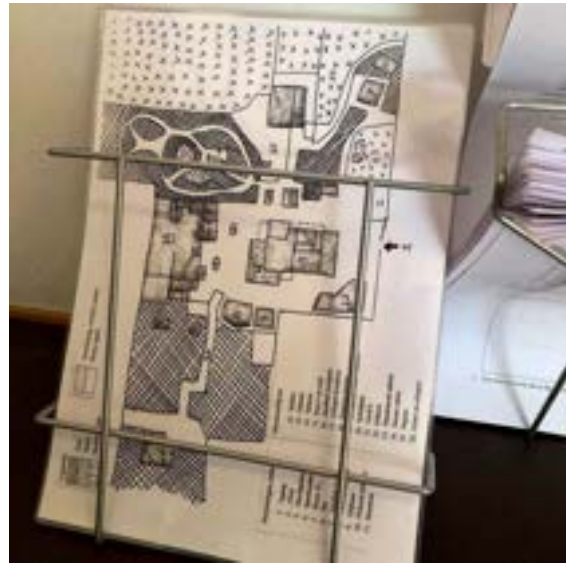
De plattegrond met dierenverblijven en voorzieningen, ontwikkeld voor de speurtochten.