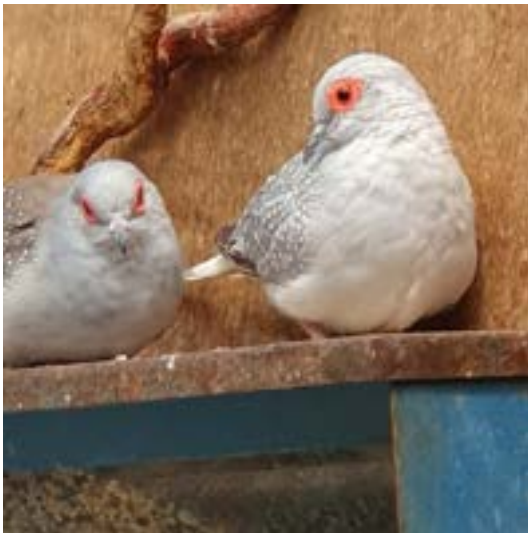
Diamantduifjes — vooral zij verpesten de pas geveegde vloer.

— Een vaste vrijwilliger, schoonmaak volière