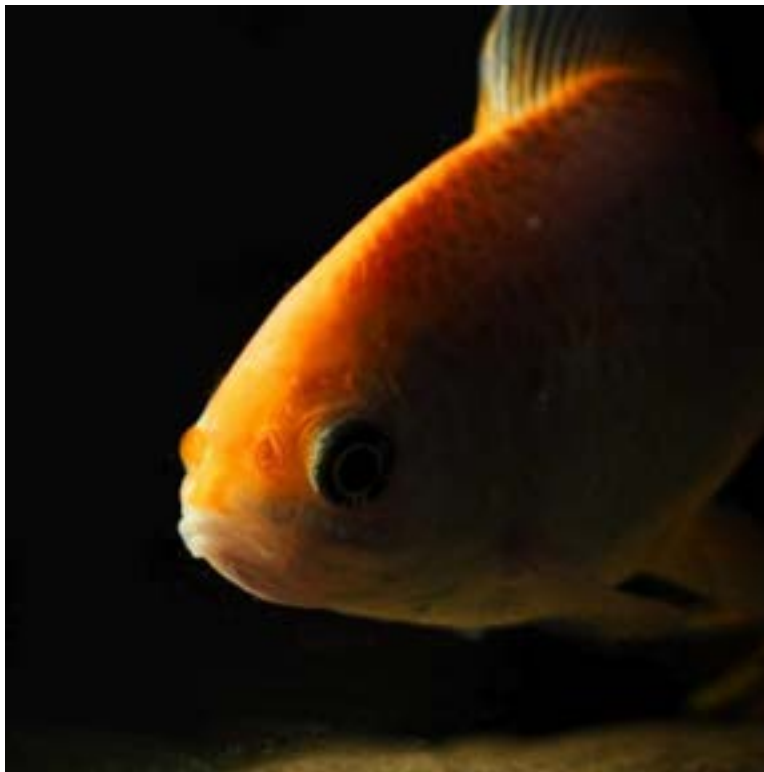
Goudvis Goldie — een kwart eeuw bij kinderboerderij de Pijp.

Toen Goldie uiteindelijk overleed, voelde dat voor team en vaste bezoekers als het einde van een kleine, maar lange geschiedenis. Een dier dat zo lang op de boerderij leeft, wordt deel van het dagelijks decor én van de herinneringen van kinderen die hier zijn opgegroeid. Met het afscheid van Goldie stonden we opnieuw stil bij het belang van goede zorg voor oudere dieren — óók als het gaat om ogenschijnlijk “gewone” dieren zoals een goudvis.