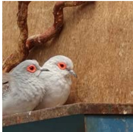
Onbevreesd benaderen ze de schoonmaker steeds dichterbij.