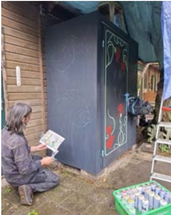
Het beginstadium — contouren op de unit.

In de kleinere toiletunit bij de educatieve ruimte lag de nadruk vooral op sfeer en educatie. Binnen hebben we de ruimte opgefleurd met allerlei weetjes over poep, zodat een toiletbezoek ook een leerzaam moment kan zijn. De buitenkant van deze unit, die eerder grijs was en weinig opviel, is door een kunstenaar prachtig beschilderd met dieren. Wat eerst een wat lelijk en onopvallend hoekje was, is zo veranderd in een vrolijk en educatief toilethuisje dat goed past bij de uitstraling van de boerderij.