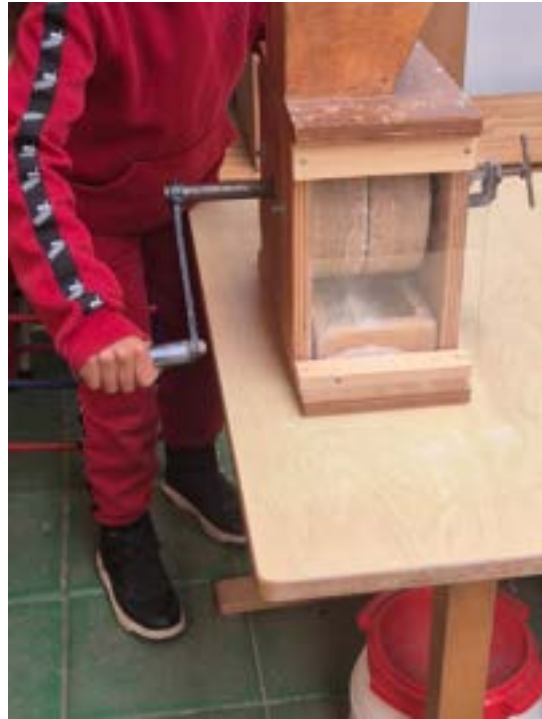
Eigen meel vermalen — eerst met de vijzel, daarna met de handmolen.

Bij het koeienmelken komt het verhaal van de melk. Wie maakt melk? Alle zoogdieren — afgestemd op de leeftijd. In de educatieve ruimte staat een kunstkoe gevuld met water, die de kinderen kunnen melken. Daarbij wordt verteld waarom een koe eigenlijk melk geeft: er moet elk jaar een kalfje geboren worden, koeien geven nooit zomaar uit het niets melk.