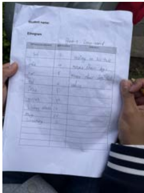
Leerlingen voeren een ethogram in bij het konijnenverblijf — stap voor stap noteren ze het gedrag dat ze observeren. Onder hen handgeschreven waarnemingen van een loopeend: zitten, lopen, eten, drinken, rondkijken.